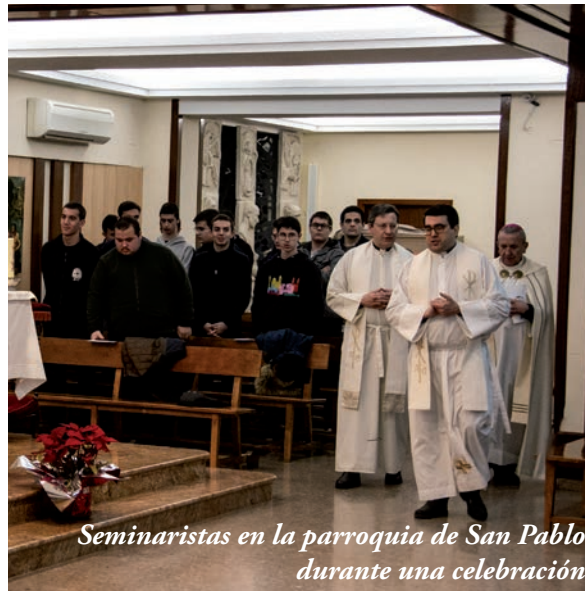
Seminaristas en la parroquia de San Pablo durante una celebración

¡Cuántos niños y jóvenes han llegado a nuestro seminario! Con sus maletas cargadas de ropa, libros, ordenadores e ilusiones —muchas ilusiones—, han dejado su pueblo, su familia, sus amigos,